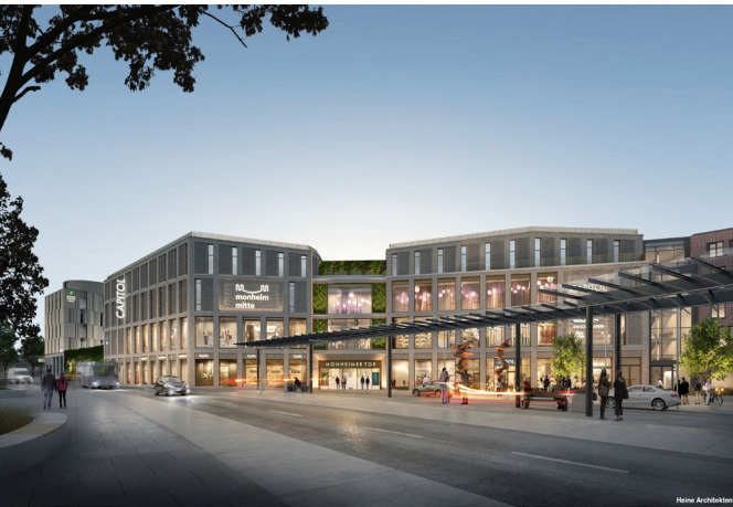
Visualisierung Heine Architekten